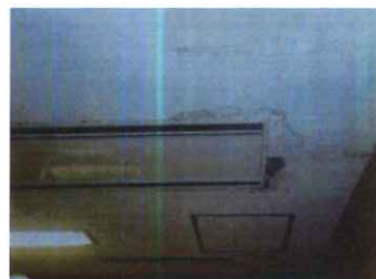
【空調設備(ファンコイル)】